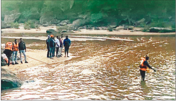
घटनास्थल जहां डूबा था युवक।