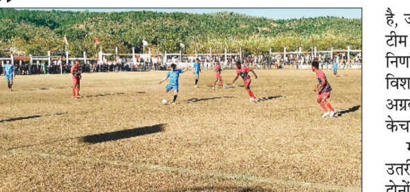
मैच खेलते खिलाड़ी।