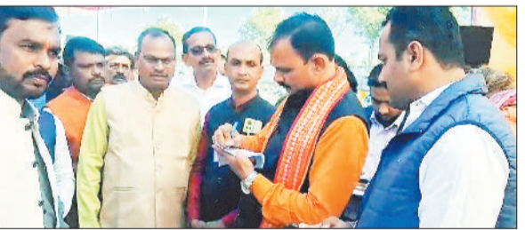
स्वास्थ्य मंत्री को ज्ञापन सौंपते ग्रामीण।

बैकुंठपुर। एमसीबी जिले के नागपुर में एम्बुलेंस और मेडिकल ऑफिसर की सुविधा देने के लिए