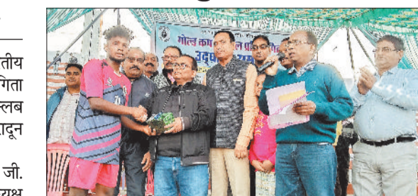
पुरस्कृत होते खिलाड़ी।

हरिभूमि न्यूज | चरचा कॉलेरी कोयलांचल क्षेत्र में 48 वां अखिल भारतीय सेशन स्मृति गोल्ड कप फुटबॉल प्रतियोगिता का दूसरे दिन रविवार को न्यू स्पोर्टिंग क्लब चरचा वर्सेज गडवाल स्पोर्टिंग देहरादून उत्तराखंड के मध्य खेला गया।