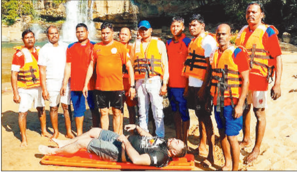
रेस्क्यू कर निकाला गया शव।

हरिभूमि न्यूज | बैकुंठपुर कोरिया जिले का प्रसिद्ध पर्यटन स्थल गौरघाट जल प्रपात में शनिवार को पिकनिक मनाने गए एक युवक की डूबने से मौत हो गई। जल प्रपात के गहरे पानी में डूबे युवक का शव दूसरे दिन रविवार को रेस्क्यू टीम के गोताखोरों के द्वारा सुबह के समय निकाला जा सका। पुलिस ने मर्ग कायम कर मामले को विवेचना में लिया।